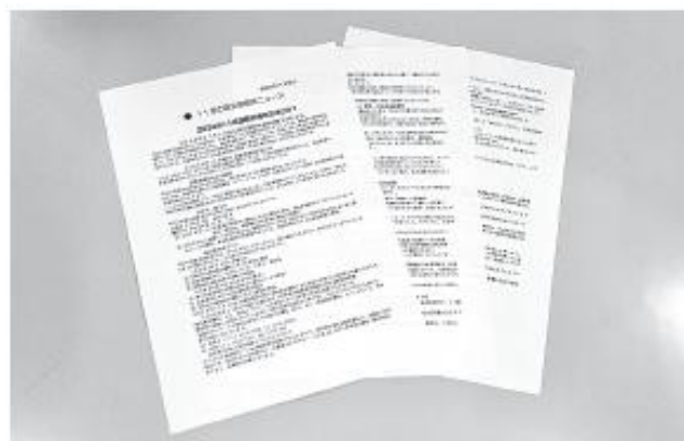
▲安全管理室が発行している「安全管理ニュース」