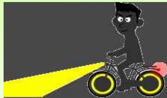
これだとあまり目立たないので