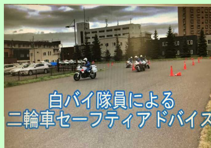
白バイ隊員による 二輪車セーフティアドバイス