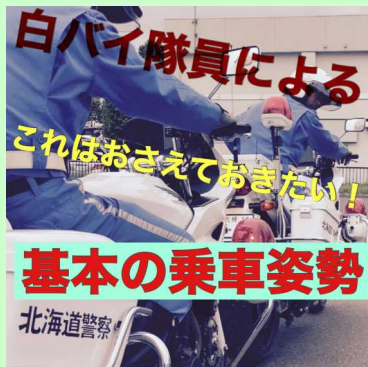
↑動画のサムネイルです