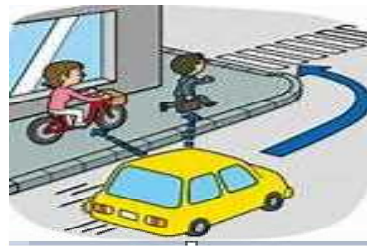
左折巻き込み確認の徹底