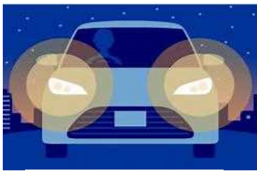
早めのライト点灯